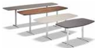
5 WILSON CONSOLLE CM 150X50 H45